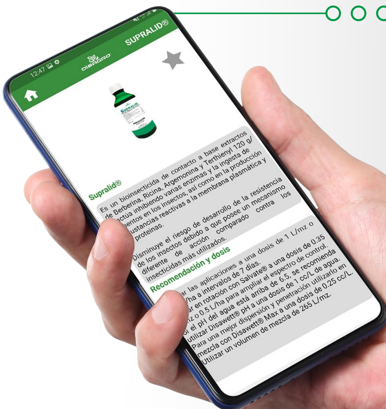
Aplicación Crop Programs con las ventanas de aplicación de Supralid® para diferentes cultivos

Para el control de mosca blanca se recomienda una dosis de: 1.5 litros de Supralid® por hectárea en un volumen de agua que garantice el mayor contacto de la mezcla con la plaga. Debido a que el producto es de contacto se recomienda agregar Disawet Maxx en una dosis de 0.25 mililitros por litro de agua. Además, por el comportamiento de la plaga, es importante seleccionar un método de aplicación que llegue al envés de las hojas pues allí es donde se hospedan los estados inmaduros o ninfas de la plaga.