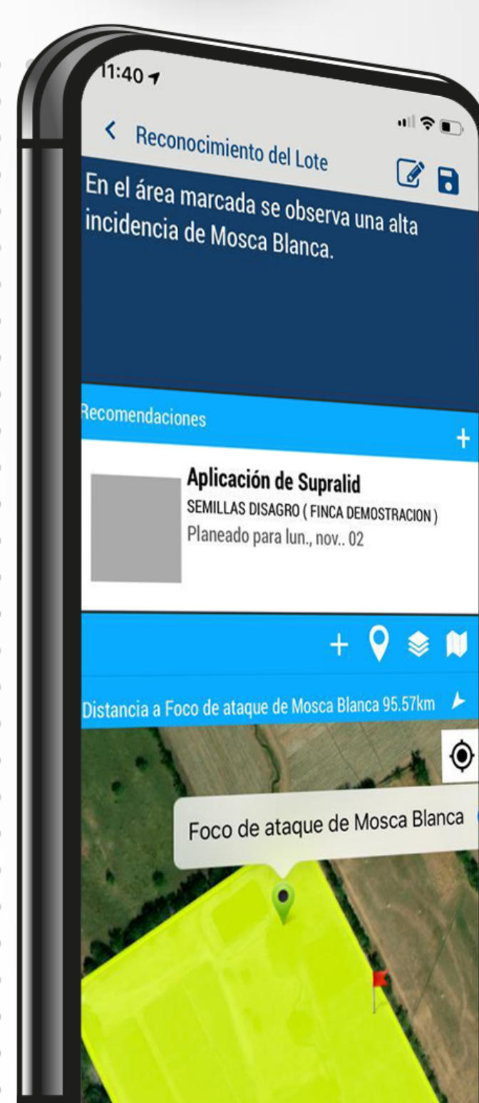
Función de reconocimiento de lote dentro de la aplicación de AgritecGEO®

Además, AgritecGEO cuenta con herramientas de diagnóstico como: clima inteligente, seguimiento nutricional, monitoreo satelital y análisis de muti-residuos; que de forma individual o en conjunto ayudan al agricultor a estructurar los tres pasos que soportan un proyecto de manejo integrado de plagas, es decir: prevenir, observar e intervenir. Para conocer como contratar estos servicios, contacte a su consultor asignado.