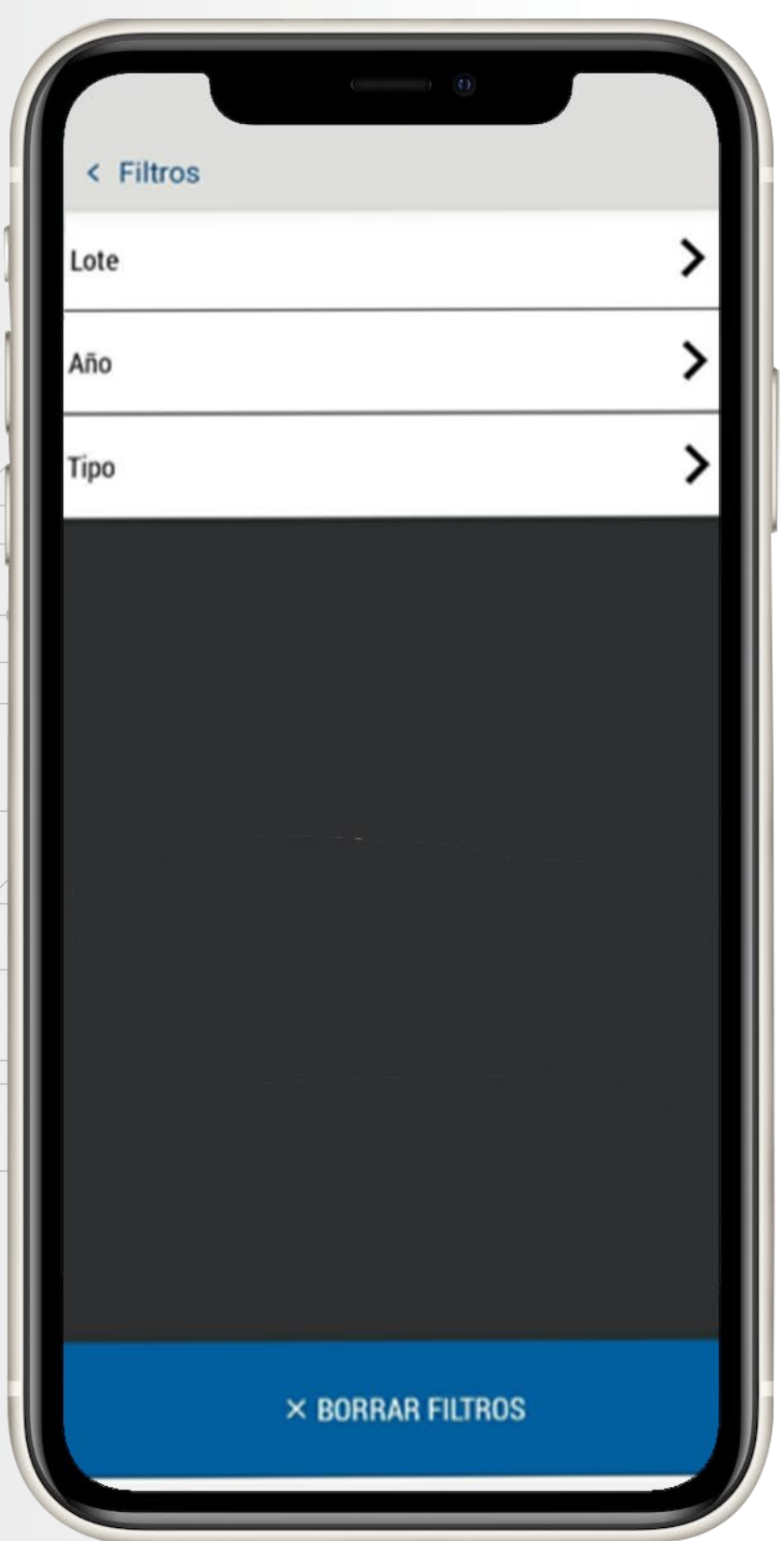
Visualización de los filtros que pueden ser aplicados en el módulo de documentos del SAF de AgritecGEO®

Una de las principales ventajas de esta funcionalidad del SAF de AgritecGEO® , es que permite centralizar el almacenamiento de la información por lo que se evitan pérdidas relacionadas a daños en dispositivos físicos o similares. De igual forma, tener la información almacenada en su usuario del SAF de AgritecGEO® permite que todos los usuarios a los que les dé acceso puedan consultar esta información desde cualquier dispositivo.