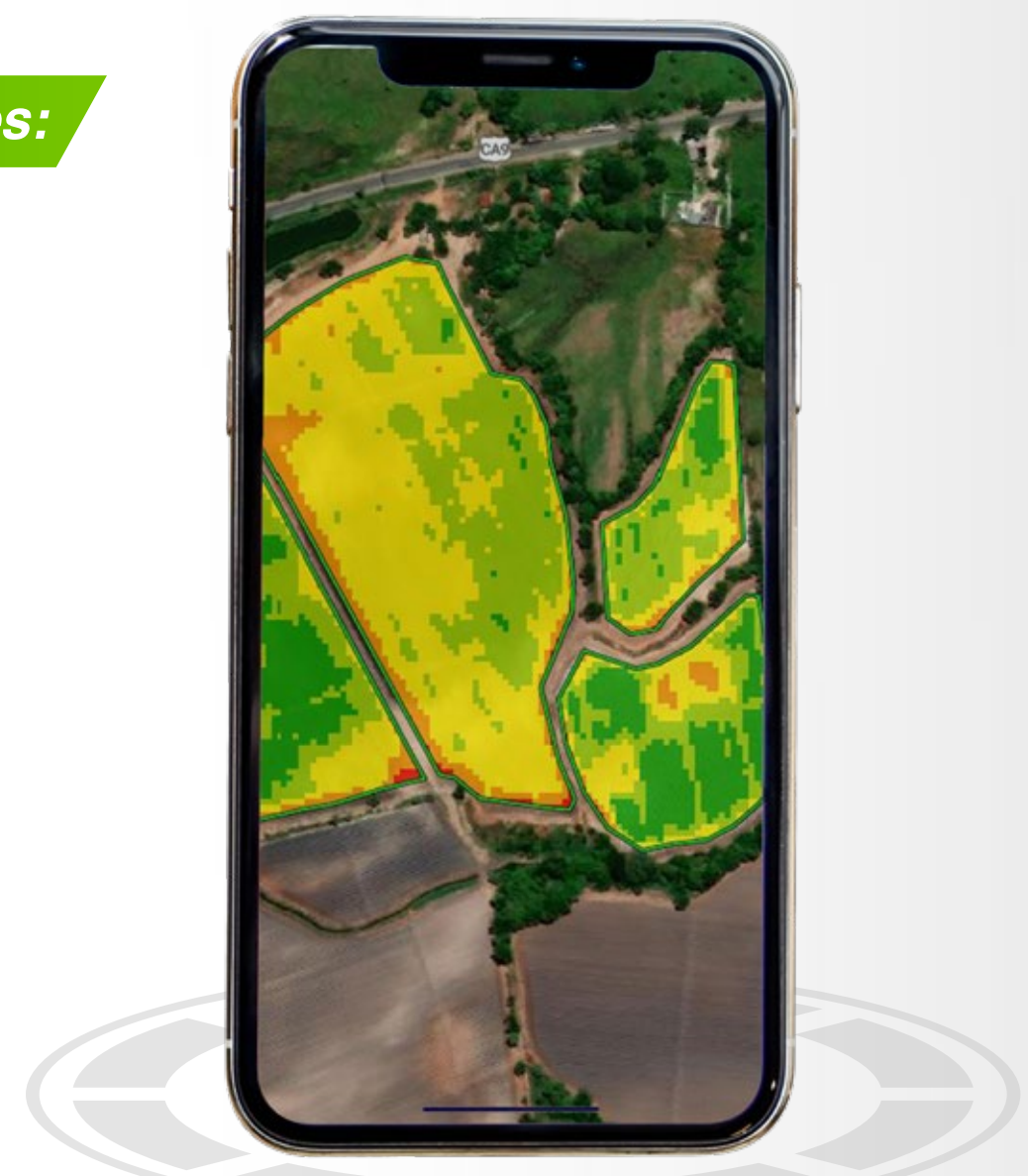
Identificación de áreas estresadas dentro de AgritecGEO®

En conclusión, los bioestimulantes han demostrado que aplicados en el momento y la dosis adecuada permiten maximizar el potencial genético de la planta; pueden inducir cambios hormonales como la activación del desarrollo vegetativo o reproductivo y pueden convertirse en una fuente de energía complementaria en aquellos periodos fisiológicos de máxima demanda como fecundación masiva de flores y posterior amarre y formación de frutos. DISAGRO , por conocer estos beneficios, ha desarrollado la línea de productos BioSmart® , la cual incluye una diversidad de productos bioestimulantes que inducen los beneficios anteriormente expuestos.